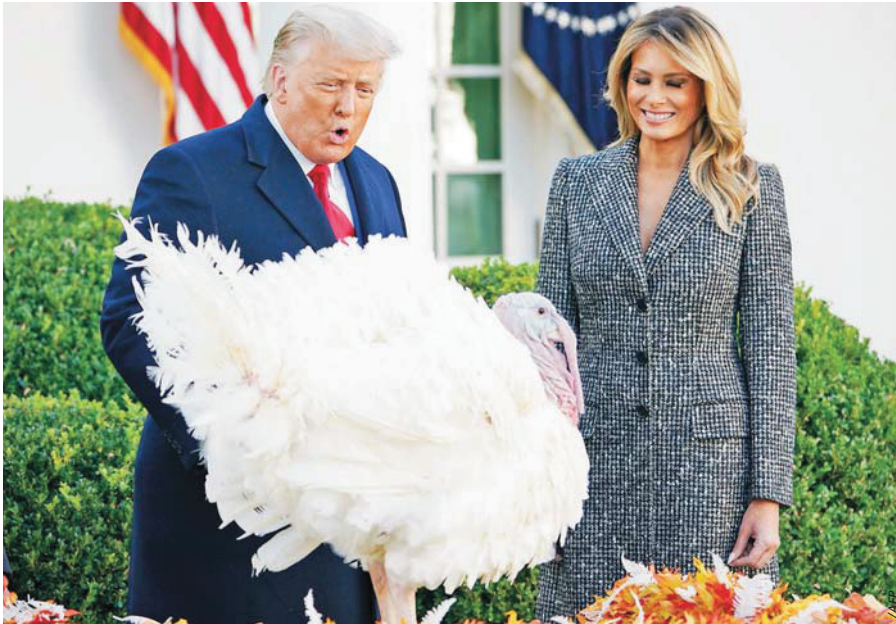
Indultado. El presidente de los Estados Unidos, Donald Trump, acompañado por su esposa Melania Trump, le perdonó la vida al pavo nacional en la celebración del Día de Acción de Gracias, durante el evento tradicional en el Rose Garden de la Casa Blanca.

● A cinco semanas del plazo final, la exguerrilla no daría más bienes para reparar víctimas. Una falencia más de un proceso con resultado crítico a 4 años del Acuerdo de Colón/4A, 4B y 5B